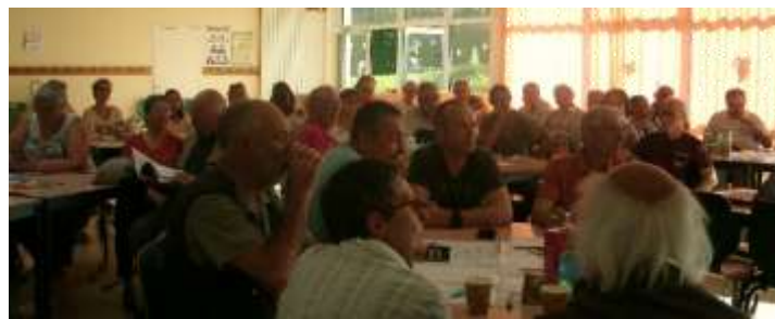
Larnicol – 50 participants