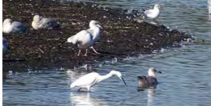
Aigrette et goélands à la recherche de nourriture