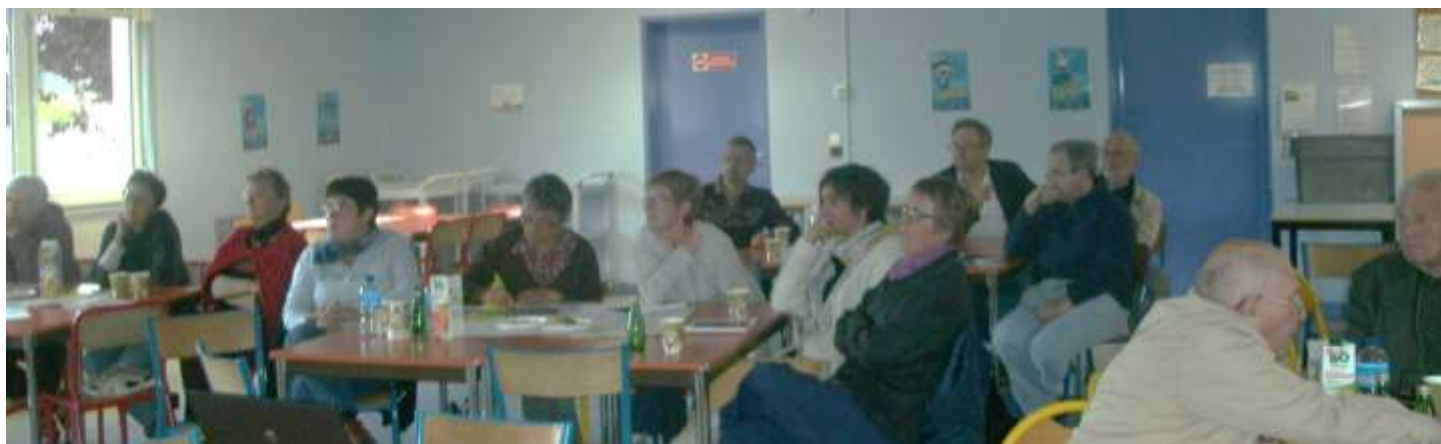
Romain Rolland – 25 participants