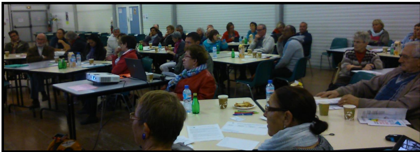
Salle Delaune – 50 participants