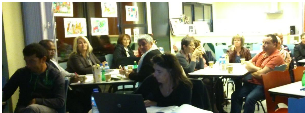
Maison Ti Penher – 20 participants