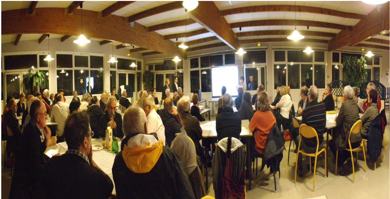
Restaurant scolaire Pablo Picasso – 65 participants