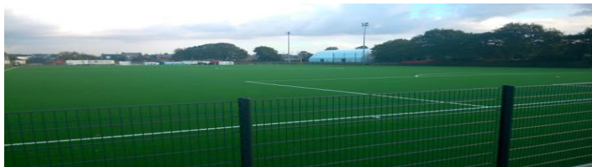
FIGURE 2 : TERRAIN DE FOOTBALL SYNTHETIQUE A LOCUNEL